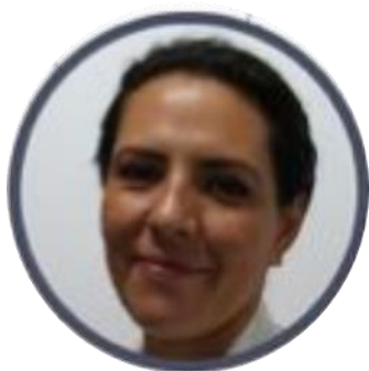
Presidenta: Dra. Aide Montante Montes de OCA